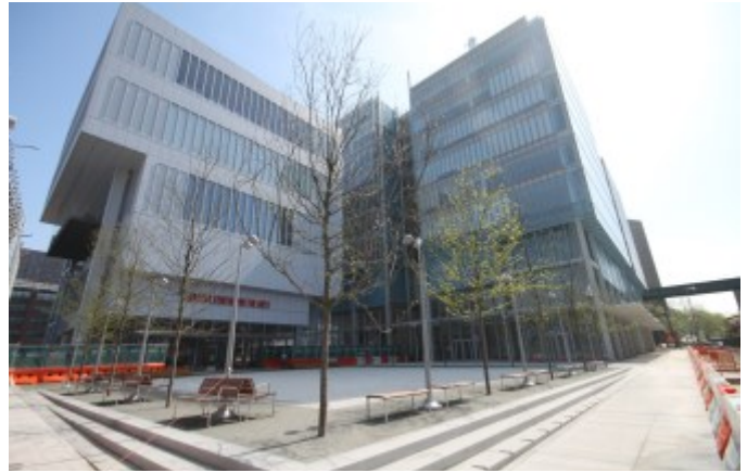
El Centro Lenfest para las Artes (izquierda) y el Centro de Ciencias Jerome L. Greene (derecha), con el Small Square en primer plano, mirando hacia noreste.