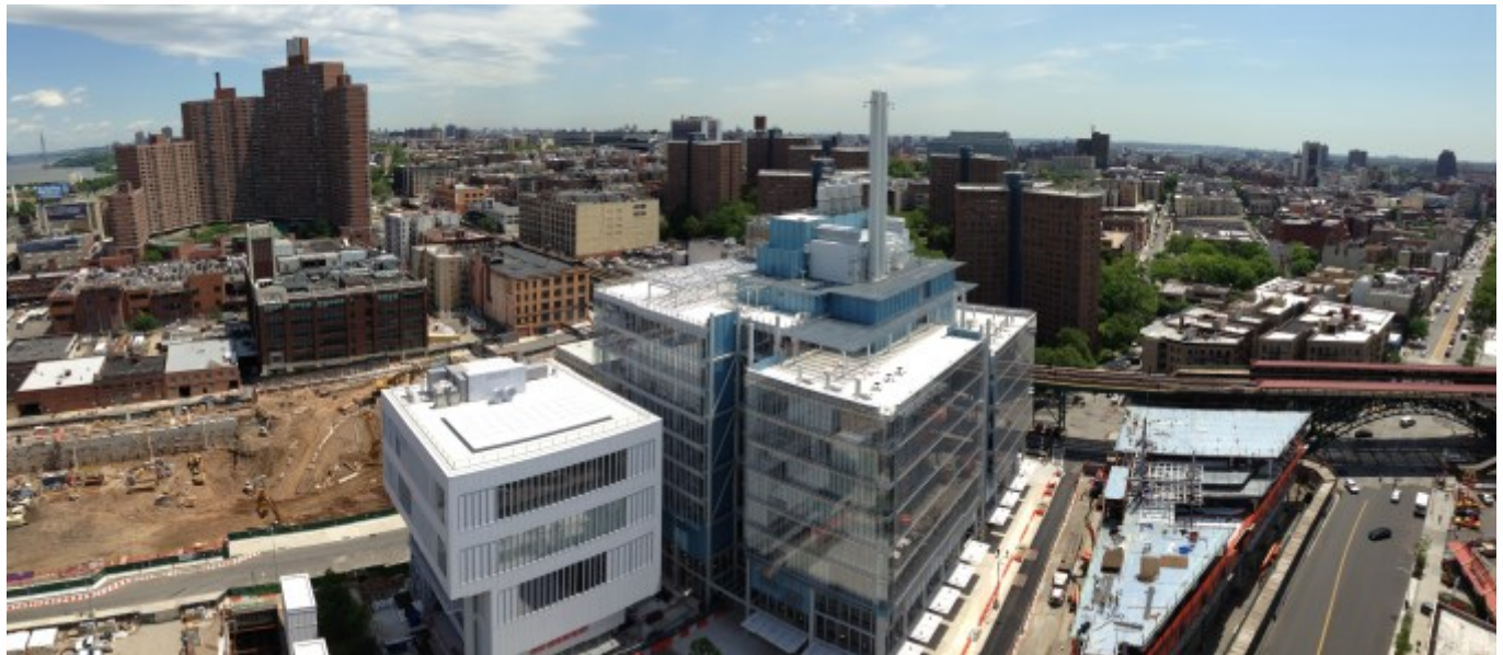
Vista aérea mirando hacia el noreste