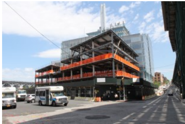
El lugar del edificio Foro, mirando hacia noroeste