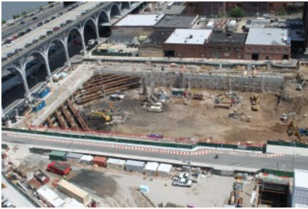
Las bases de la Fase 2, mirando hacia el norte